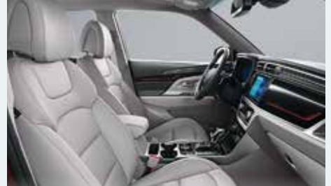
소프트 그레이 인테리어 (그레이 헤드라잉)