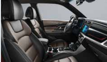
에스프레소 브라운 인테리어 (블랙 헤드라잉)