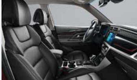
차콜 블랙 인테리어 (그레이 헤드라잉)