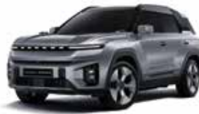
플래티넘 그레이 ADA