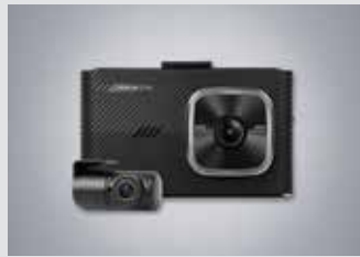
아이나비 블랙박스(16GB) 220,000원