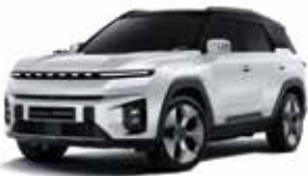
그랜드 화이트 2WA