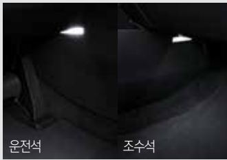
1열 풋램프 & LED 글로브 박스 램프 50,000원