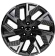
18인치 다이아몬드 커팅 휠