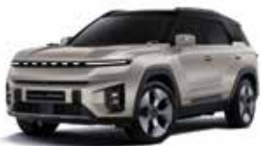
라메 그레이지 2BL