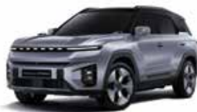
아이언 메탈 2DE