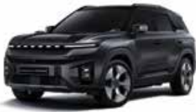
스페이스 블랙 LAK