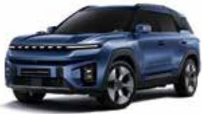
댄디 블루 BAS