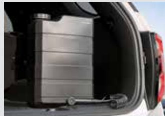
리어 패키지 (아웃도어 워터탱크 / 휴대용 멀티 에어 컴프레서) 280,000원