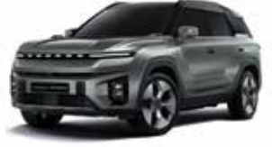
포레스트 그린 GAO