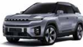
아이언 메탈 ADE