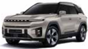
라메 그레이지 EBL