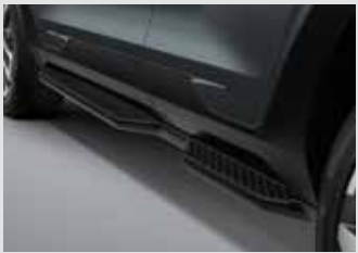
사이드 스텝(좌/우) 450,000원