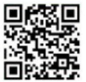
토레스 EVX 모바일 페이지