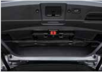
멀티 우산꽂이(우산꽂이 + 비상등 + 테일게이트 스팟램프) 150,000원