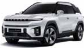
그랜드 화이트 WAA