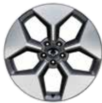
20인치 다이아몬드 커팅 휠