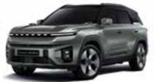
포레스트 그린 2GO

* 투톤 : 루프 / 스포일러 / C필러 : 블랙 컬러 * 투톤 선택 시 세이프티 선루프, 실버 컬러 C필러 가니쉬 선택 불가 * 본 가격표에 수록된 제품의 색상은 인쇄된 것이므로 실제 색상과 다소 차이가 있을 수 있습니다.