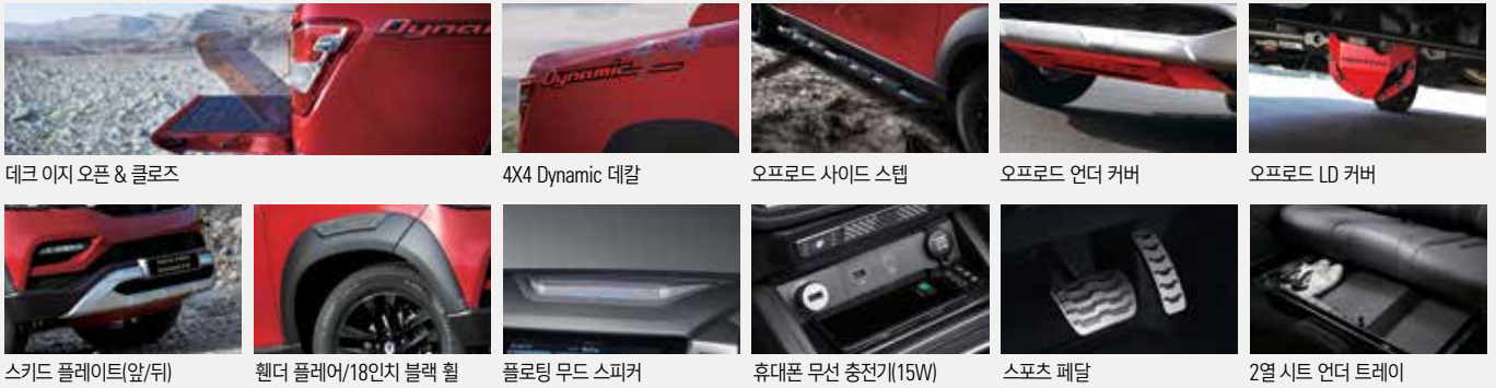
데크 이지 오픈 & 클로즈