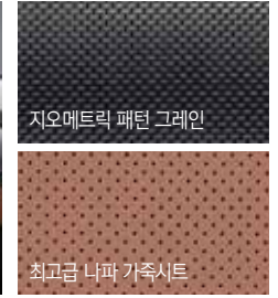
지오메트릭 패턴 그레인