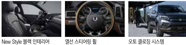
New Style 블랙 인테리어 열선 스티어링 휠 오토 클로징 시스템