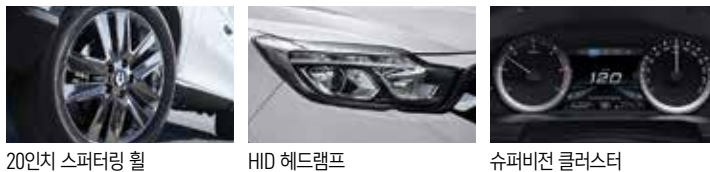
20인치 스피터링 휠 HID 헤드램프 슈퍼비전 클러스터