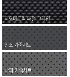
지오메트릭 패턴 그레이인