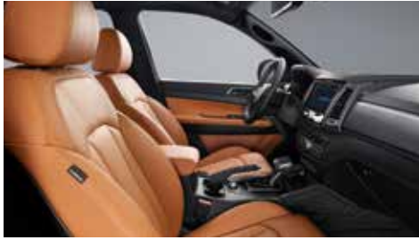
브라운 인테리어(블랙 헤드라이닝)