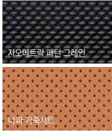
지오메트릭 패턴 그레이인