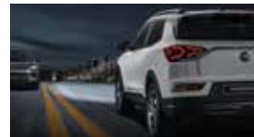
스마트 하이빔 SHB