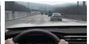
고속도로 안전 속도 제어 SSA