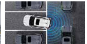
후측방 접근 경고 RCTW