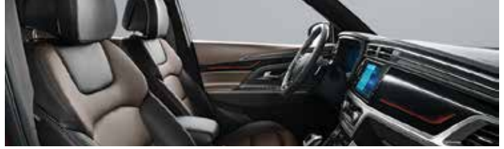
에스프레소 브라운 인테리어(블랙 헤드라이닝)