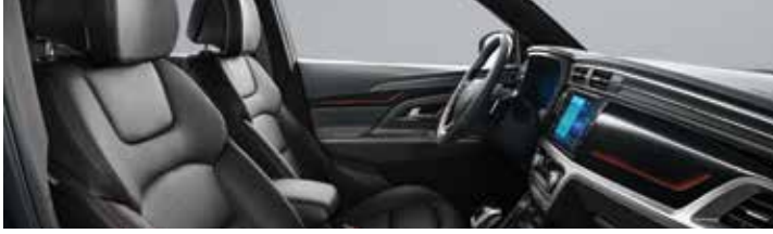
R-PLUS 전용 인테리어(블랙 헤드라이닝)