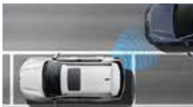
안전 하차 경고 SEW

카메라와 레이더를 통해 주변 상황을 완벽하게 스캐닝하고 차량을 안전하게 제어해 주는 최첨단 자율주행 시스템입니다.