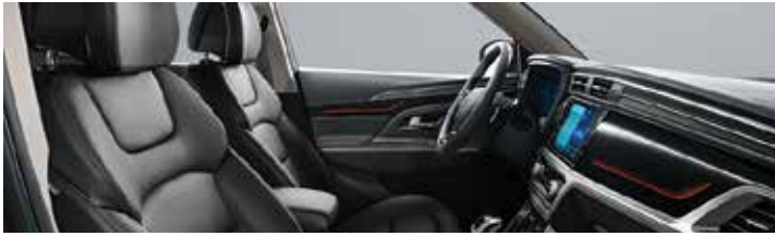
차콜 블랙 인테리어(그레이 헤드라이닝)