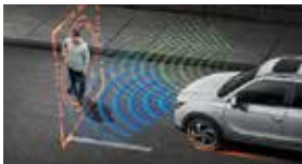
긴급 제동 보조 AEB