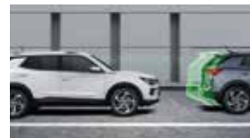
앞차 출발 경고 FVSW