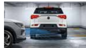
후측방 접근 충돌 보조 RCTA