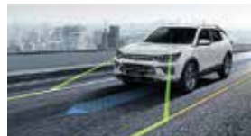
중앙 차선 유지 보조 CLKA