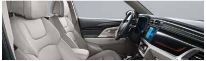
소프트 그레이 인테리어(그레이 헤드라이닝)