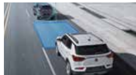
안전 거리 경고 SDW