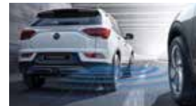
후측방 경고 BSW