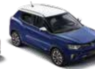
바디컬러 덴디 블루 루프/리어 스포일러/ 아웃사이드 미러_화이트