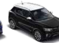
바디컬러 스페이스 블랙 루프/리어 스포일러/ 아웃사이드 미러_화이트

* 블랙 루프 선택 시 아웃사이드 미러 컬러는 바디컬러가 적용되며, 화이트 루프 선택 시 아웃사이드 미러 컬러는 화이트가 적용됨 * 본 가격표에 수록된 제품의 색상은 인쇄된 것이므로 실제 색상과 다소 차이가 있을 수 있습니다.