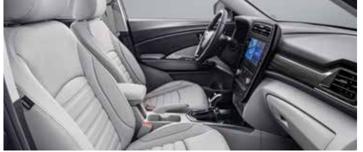
소프트 그레이 인테리어(그레이 헤드라이닝)