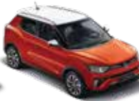
바디컬러 오렌지 팝 루프/리어 스포일러/ 아웃사이드 미러_화이트