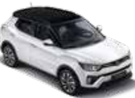
바디컬러/아웃사이드 미러 그랜드 화이트 루프/리어 스포일러 블랙