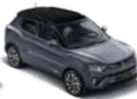
바디컬러/아웃사이드 미러 플래티넘 그레이 루프/리어 스포일러 블랙