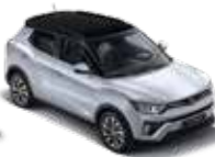
바디컬러/아웃사이드 미러 사일런트 실버 루프/리어 스포일러 블랙