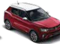
바디컬러 체리 레드 루프/리어 스포일러/ 아웃사이드 미러_화이트