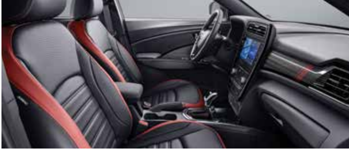
버건디 투톤 인테리어(블랙 헤드라이닝)