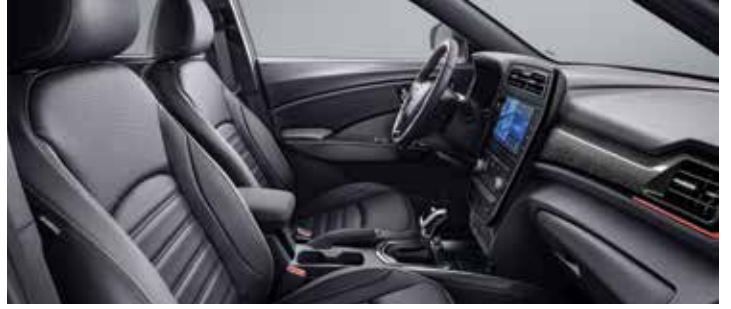
레드 포인트 인테리어(블랙 헤드라이닝)