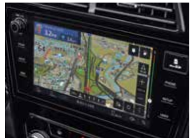
실시간 최적화 길안내