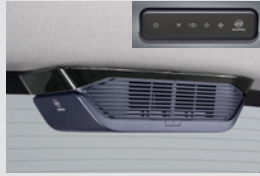
루프형 공기청정기 280,000원