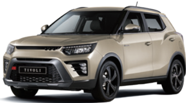
라떼 그레이지 EBL