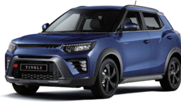
만디 블루 BAS