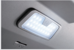
테일게이트 LED 램프 120,000원