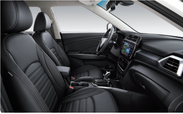
블랙 인테리어 (그레이 헤드라이닝)