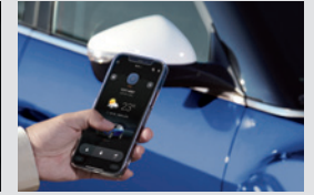
디지털 스마트 키 320,000원