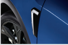
휠더 & 도어 가니쉬 270,000원