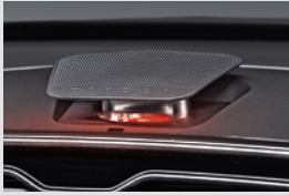
플로팅 무드 스피커 360,000원