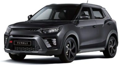
스페이스 블랙 LAK

* 본 가격표에 수록된 제품의 색상은 인쇄된 것이므로 실제 색상과 다소 차이가 있을 수 있습니다.