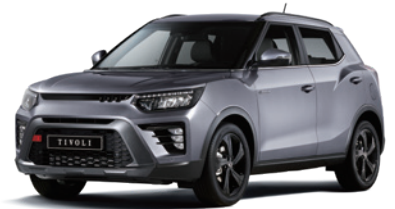
아이언 메탈 ADE