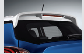
윙 스포일러 170,000원