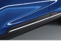
사이드 실 세트 250,000원