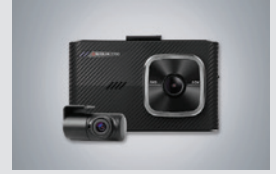
아이나비 블랙박스(16GB) 220,000원