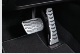
스포츠 페달 40,000원