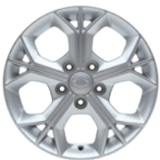
16인치 알로이 휠