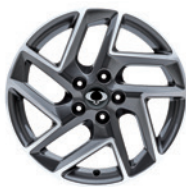
17인치 다이아몬드 커팅 휠