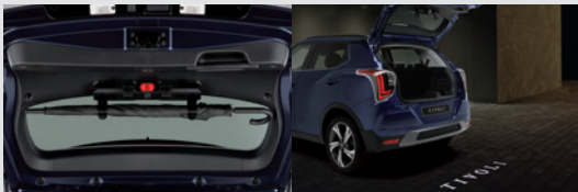
멀티 우산꽂이(우산꽂이 + 비상등 + 테일게이트 스팟램프) 150,000원