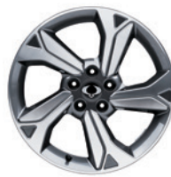
18인치 다이아몬드 커팅 휠