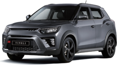
플래티넘 그레이 ADA