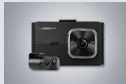
아이나비 블랙박스(16GB) 220,000원