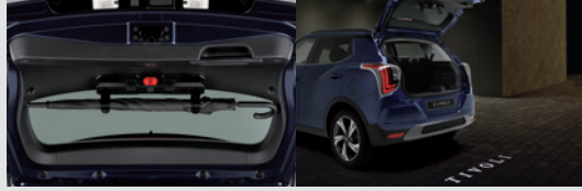
멀티 우산꽂이(우산꽂이 + 비상등 + 테일게이트 스팟램프) 150,000원