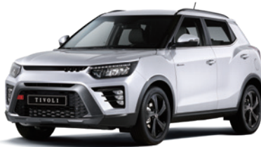
그랜드 화이트 WAA