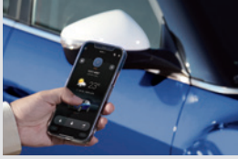
디지털 스마트 키 320,000원