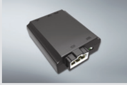
에어컨 습기 건조기 160,000원