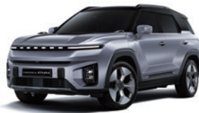
아이언 메탈 2DE