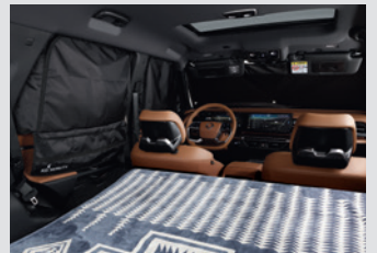
멀티 커튼 100,000원