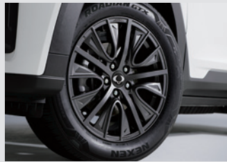
18인치 단조휠 2,480,000원