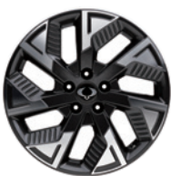
18인치 다이아몬드 컷팅 휠