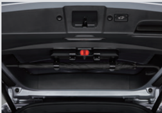
멀티 우산꽃이(우산꽃이 + 비상등 + 테일게이트 스팟램프) 150,000원