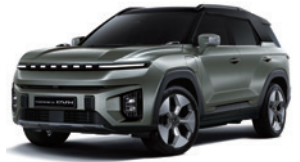
포레스트 그린 2GO

* 투톤 : 루프 / 스포일러 / C필러 : 블랙 컬러 * 투톤 선택 시 세이프티 선루프, 실버 컬러 C필러 가니쉬 선택 불가 * 본 가격표에 수록된 제품의 색상은 인쇄된 것이므로 실제 색상과 다소 차이가 있을 수 있습니다.