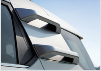
루프 클라이밍 핸들(블랙 기본/실버 옵션) 300,000원