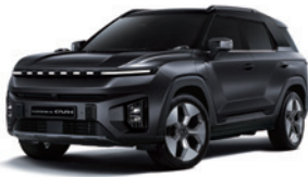
스페이스 블랙 LAK