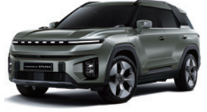
포레스트 그린 GAO