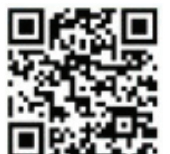
토레스 EVX 모바일 페이지