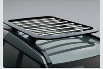
루프 플랫폼 캐리어 800,000원