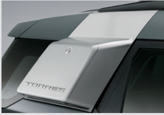
사이드 스토리지 박스(블랙 기본/실버 옵션) 300,000원