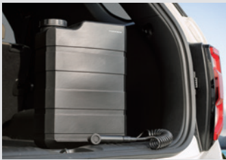
리어 패키지(아웃도어 워터탱크 / 휴대용 멀티 에어 컴프레서) 280,000원