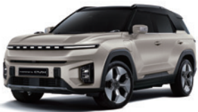
라메 그레이지 2BL