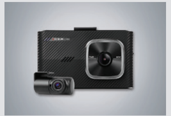
아이나비 블랙박스(16GB) 220,000원