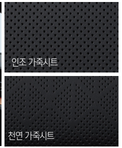
블랙 인테리어 (블랙 헤드라이닝)