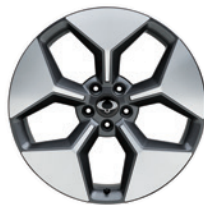
20인치 다이아몬드 컷팅 휠