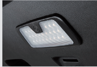
테일게이트 LED 램프 120,000원