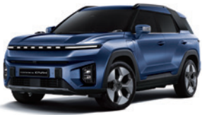
댄디 블루 BAS