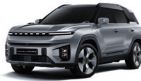
플래티넘 그레이 ADA