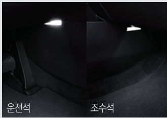
1열 풋램프 & LED 글로브 박스 램프 50,000원