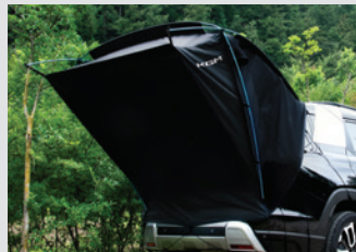
차박용 텐트 380,000원