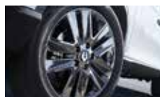
20인치 스피터링 휠