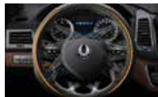
열선 스티어링 휠