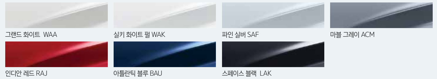
* 실키 화이트 펄은 노블레스 트림에만 적용 가능 * 본 가격표에 수록된 제품의 색상은 인쇄된 것이므로 실제 색상과 다소 차이가 있을 수 있습니다.