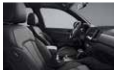
New Style 블랙 인테리어