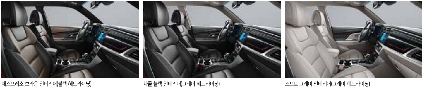
에스프레소 브라운 인테리어(블랙 헤드라잉)