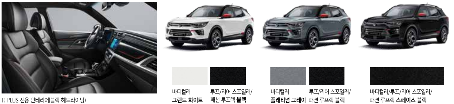
R-PLUS 전용 인테리어(블랙 헤드라잉)