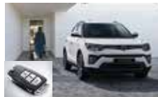
스마트키 시스템(오토 클로징)