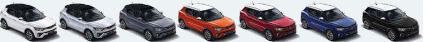
바디컬러/아웃사이드 미러 그랜드 화이트