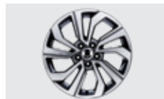
18인치 다이아몬드 커팅 휠