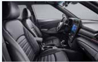
레드 스티치 인테리어 (블랙 헤드라잉) * 리미티드 에디션 전용