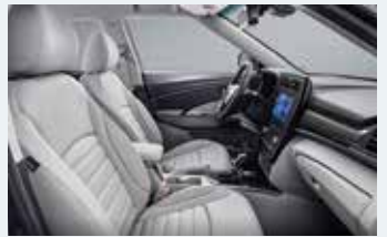
소프트 그레이 인테리어 (그레이 헤드라잉)