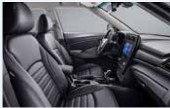
블랙 인테리어 (그레이 헤드라잉)