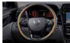
열선 스티어링 휠