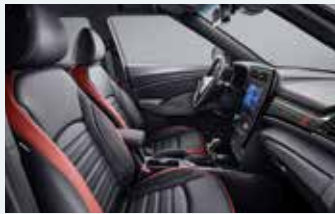
버건디 투톤 인테리어(블랙 헤드라잉)