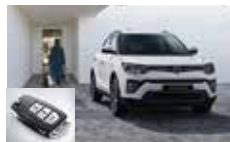
스마트키 시스템(오토 클로징)