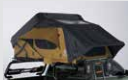
하드셸 루프탑 텐트 2,900,000원