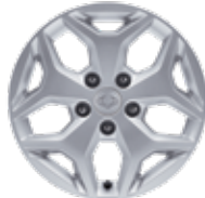
18인치 알로이 휠