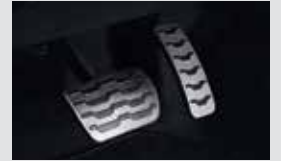
스포츠 페달 40,000원