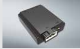
에어컨 습기 건조기 160,000원