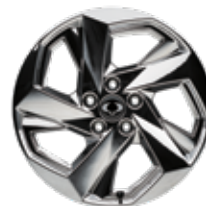
뉴 디자인 20인치 스퍼터링 휠