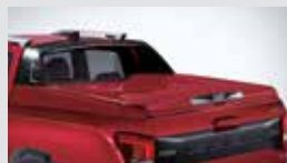
그랜드 하드탑(L6) 2,035,000원