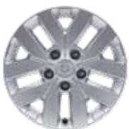
17인치 알로이 휠