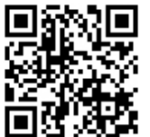
렉스턴 스포츠 칸 쿨멘 모바일 페이지

최고출력 202ps/3,800rpm 최대토크 45kg·m/1,600~2,600rpm