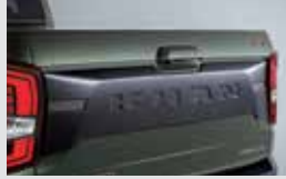
테일게이트 가니쉬 200,000원