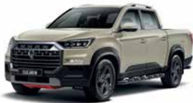
샌드스톤 베이지 EBK