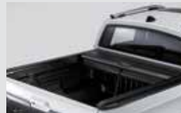
슬라이딩 커버 1,300,000원