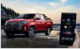
디지털 스마트 키 320,000원