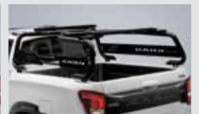
범퍼 롤바 980,000원