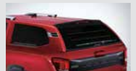
뉴 디렉스 하드탑(L4) 1,870,000원

* 상기 품목은 취급 설명서 내 커스터마이징 품목 보충서에 따라 보충 적용됩니다.