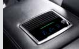
빌트인 공기청정기 400,000원