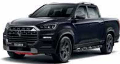
갤럭시스 그레이 ADB