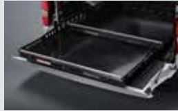
슬라이딩 베드 640,000원