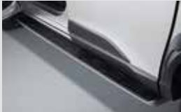
고정식 사이드 스텝 360,000원