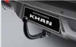
트레일러 히치 13핀 1,300,000원