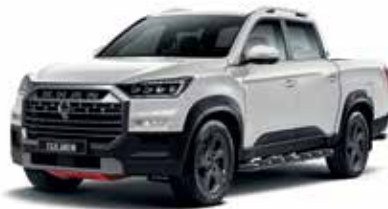
그랜드 화이트 WAA