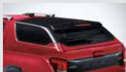
노블 하드탑(L7) 2,145,000원