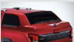
디렉스 컵탑(L9) 2,200,000원