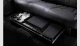
2열 시트 언더트레이 200,000원