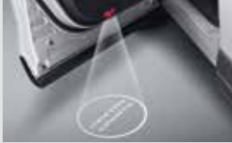
도어 스탭램프 & LED 도어스커프 230,000원