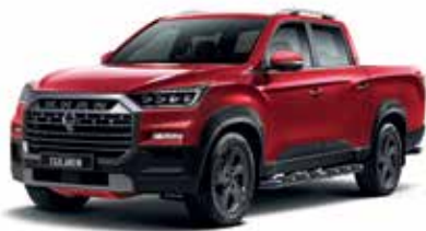
인디안 레드 RAJ

* 본 가격표에 수록된 제품의 색상은 인쇄된 것이므로 실제 색상과 다소 차이가 있을 수 있습니다.