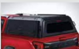
캐노피 탑 2,800,000원