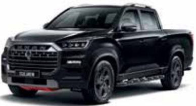
스페이스 블랙 LAK