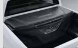
멀티 유틸리티 박스 510,000원