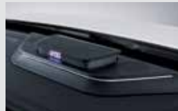
플로팅 센터 스피커 390,000원