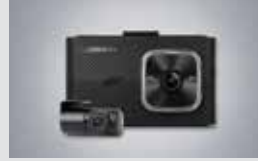
아이나비 블랙박스(16GB) 220,000원