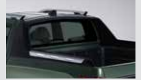
패션 데크랙 1,100,000원