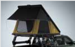
A형 루프탑 텐트 2,800,000원