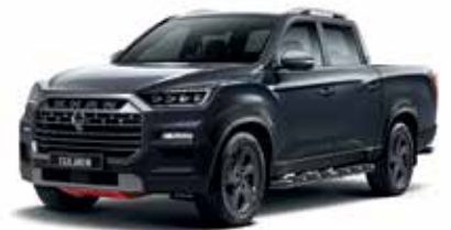
마블 그레이 ACM