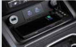
휴대폰 무선충전기(15W) 160,000원