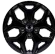
18인치 블랙 알로이 휠