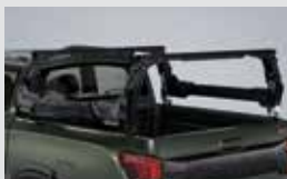
멀티 카고랙 1,350,000원