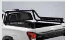
모던 롤바 720,000원