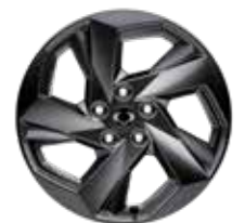
뉴 디자인 20인치 다크 스퍼터링 휠