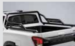
유틸리티 바 720,000원