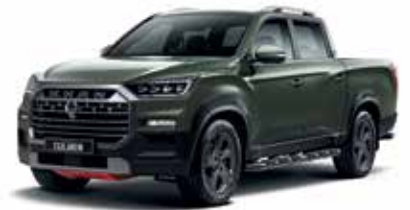
아마조니아 그린 GAM